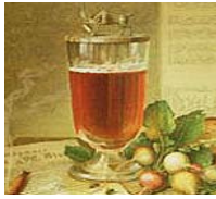
1614: Der Maibock von HB-Münchens ältestes Bockbier

William Shakespeare stellte fest: "Denn eine Kanne Bier, das ist ein Königreich."