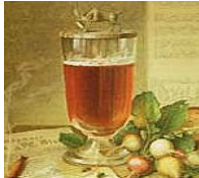
1614: Der Maibock von HB- Münchens ältestes Bockbier

William Shakespeare stellte fest: „Denn eine Kanne Bier, das ist ein Königreich.“