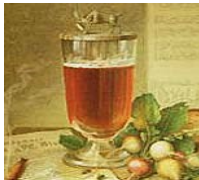
1614: Der Maibock von HB- Münchens ältestes Bockbier

William Shakespeare stellte fest: „Denn eine Kanne Bier, das ist ein Königreich.“